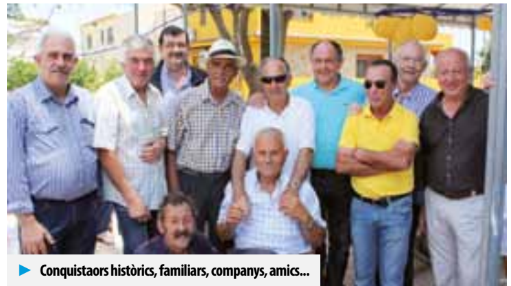
► Conquistadors històrics, familiars, companys, amics...