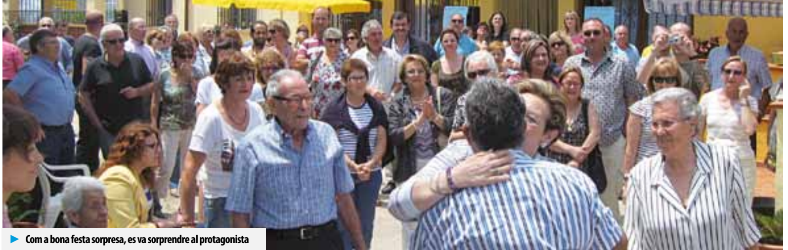
► Com a bona festa sorpresa, es va sorprendre al protagonista