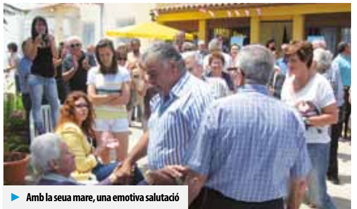
► Amb la seua mare, una emotiva salutació