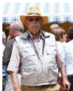
► El tio Carmel també va fer acte de presència