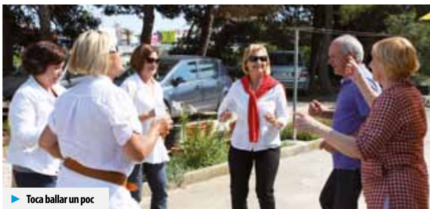
► Toca ballar un poc