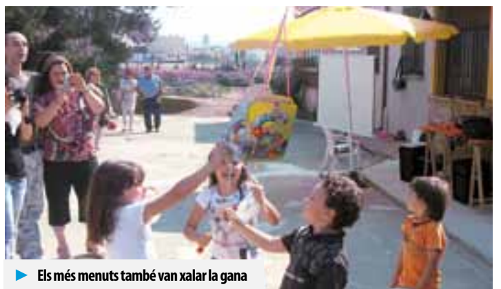
► Els més menuts també van xalar la gana