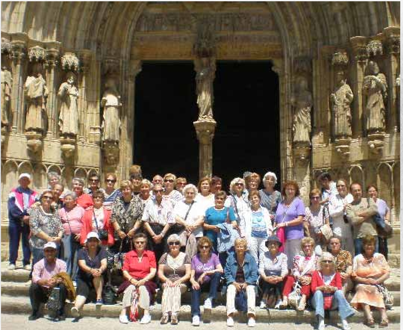
► El passat 24 de maig, l'alumnat del Centre de Formació de Persones Adultes de Benicarló va gaudir d'un dia de germanor a Morella i la Balma.