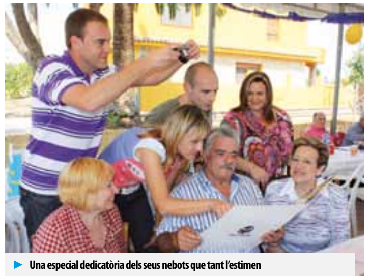
► Una especial dedicatòria dels seus nebots que tant l'estimen