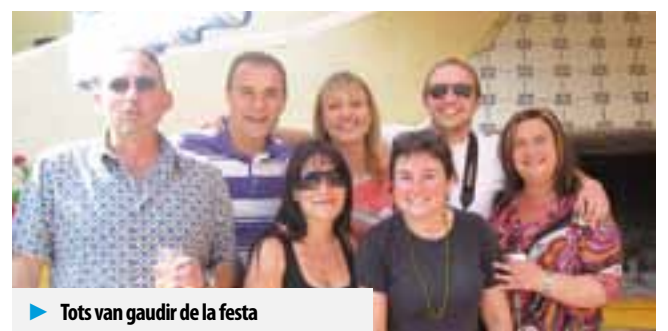
► Tots van gaudir de la festa