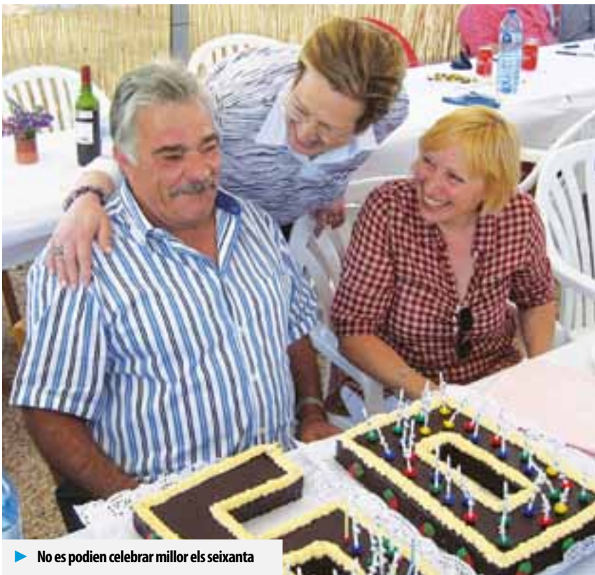
► No es podien celebrar millor els seixanta