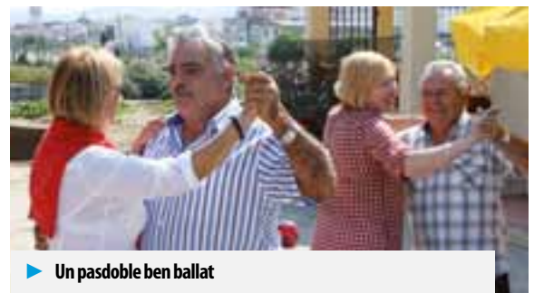
► Un pasdoble ben ballat