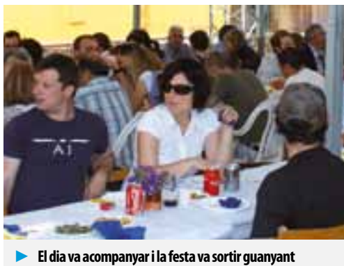
► El dia va acompanyar i la festa va sortir guanyant